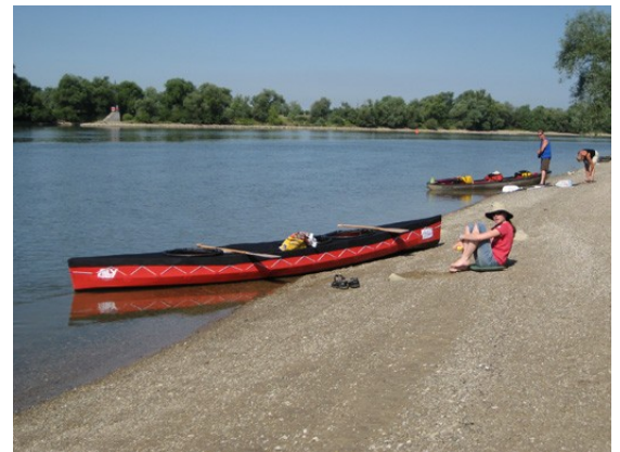
Nur keine Hektik, der Weg ist unser Ziel

A: Recht steiler ca. 10m hoher Abhang hinauf, dann 300m ebener Fußweg. I: ausreichende Sanitäreinrichtungen des Sportplatzes E: nicht erkundet