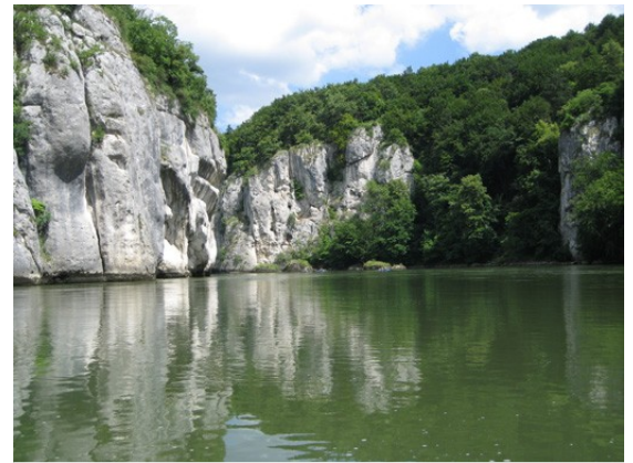
Donaudurchbruch bei Weltenburg

Eine Etappe die bei der Fahrtbesprechung als langweilig und anstrengend bezeichnet wird, erscheint uns ganz anders. Lang stimmt, wir sind 11 Stunden unterwegs, aber langweilig?? Der Tag gestaltet sich abwechslungsreich und voll von neuen Eindrücken. Zunächst die Kleinbootschleuse von Regensburg, dann einwenig Strömung. Später biegen wir durch einen wunderbaren Altarm ab, in