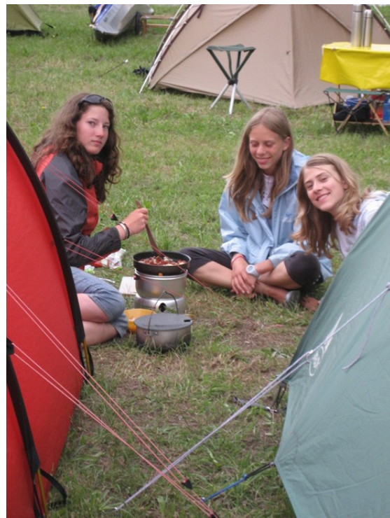
Glückliche Selbstversorgerinnen Eines meiner liebsten Bilder.

Am Ortsende von Aschach finden wir die versprochene Rampe als Ausstieg zu einem nahegelegenen Spar-Mark. Dort fallen wie ein, so wie wir sind: Barfuss, nass, in Schwimmwesten. Acht Leberkäsesemmeln und vier Tafeln Schokolade geben uns unsere Energie wieder. Auch andere Paddler treffen wir beim Spar zum gemeinsamen „Mittagessen“.