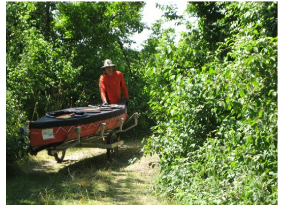
Der beste Bootswagen steht in Geising bereit

Wir nützen den Weg gleich um uns die Füße zu vertreten und für das Mittagessen. Erst viel später erfahren wir, dass es bei einer kurzen Anfrage beim Schleusenmeister auch Schleusungen für und gegeben hätte. Besonders Asterix und Obelix, die in ihren überschweren Kanadiern ihren gesamten (!) Hausrat mitführen, hätte das sehr geholfen. Die Beiden sind dabei ans Schwarze Meer zu übersiedeln oder rund um Europa zu paddeln – so genau wissen sie das noch nicht. Die TID ist ihre erste Etappe.