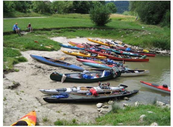
Spontane TID Treffen – oder gibt's da ein Wirtshaus

Die Autobahnbrücke von Deggendorf ist vom Regierungsrat als Sammelpunkt für die TID vorgesehen, um dann die Isarmündung – eine für die Großschiffahrt schwierige Strecke – im Pulk zu befahren. Wir haben das etwas modifiziert und haben vereinbart, nicht vor 12 Uhr unter der Brücke durch zu fahren. Für uns im Ally ohnehin eine Illusion. An der Brück wartet die Stromaufsicht auf eine Horde wild aussehender und zu allem entschlossenen Paddler. Einzig, die kommt halt nicht. Was sie beobachten sind einzelne sehr diszipliniert fahrende Boote, die so alle paar Minuten vorbei kommen. Irgendwer hat sich da etwas Falsches ausgedacht. So ist die TID jedenfalls keine Gefährdung für die Berufsschiffe. Die Großschiffe für die TID aber auch nicht. Umsicht und Toleranz sind die Schlüssel für ein friedvolles Nebeneinander.