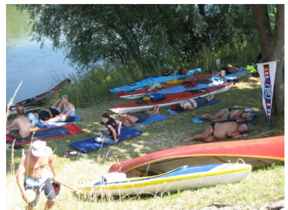
Pausetag: Jeder Schattenfleck wird genutzt

Dafür entlohnt uns dann die schöne und einfache Bootsgasse für die Anstrengungen. Nur kurz darauf legen wir beim Paddelklub an. Eine steile Treppe ist in der Hitze zu bewältigen, dann das Boot auf den Bootswagen und den ganzen Krempel über den Damm und auf die Campingwiese. In brütender Hitze wird das Zelt aufgebaut und eingerichtet – Pause für einen Tag. Ich denke wir haben das verdient.