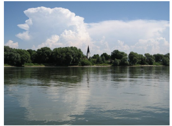
Gewitter, schon am Vormittag?

Dieser Tag bietet etwas ganz besonderes: Die TID fährt die ersten 5km als Pulk und unter Aufsicht der Wasserwacht. Warum, das weiß keiner so ganz genau, aber die Vorschrift wirkt sehr amtlich! Die deutschen Organisatoren sind besorgt um die Zukunft der TID, die Paddler kooperieren, spielen das Spiel mit und schütteln den Kopf. Immerhin gibt es so schöne Bilder mit vielen Paddlern in der Morgenstimmung – auch was Nettes.