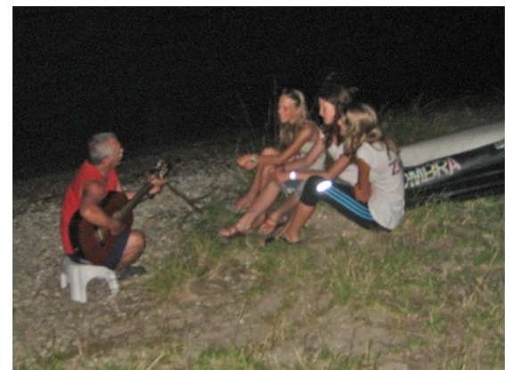
Nächtliche Musikstunde in Mautern

Die letzte längere Strecke auf unserer Tour, die letzte Schleuse mit fixen Zeiten. Also wieder ein Frühstart. Ich wecke die Mädchen wie vereinbart, das heißt ich versuche es. Beim vierten Versuch werde ich grantig und bitte die Damen vor die Zelte zur „Krisenbesprechung“. Ich werfe das Kommando hin und überlasse den Damen wie der Tag gestaltet werden soll. Zuerst große Verwunderung, dann eine kurze Beratung – und plötzlich klappt alles wie am Schnürchen. Mit nur kurzer Verzögerung kommen wir auf's Wasser. Ständig wird Geschwindigkeit, verbleibende Zeit und Distanz von den Mädels überwacht. Der Zickenexpress macht wieder einmal richtig Tempo. Knapp 7 Minuten brauchen wir für 1000m heute nur, so geht sich die Schleuse leicht aus. Wir überholen Boot um Boot, verbreiten Fröhlichkeit und ziehen davon.